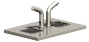
Optinen annostelija W-O-2

Festivo Buffet Line kylmävesijakelimet on tarkoitettu juomaveden jäähdyttämiseen ja annosteluun. Vesijakelimissa on kylmäkoneisto ja lasilla painettava annosteluhana (T). Jakelimiin saa myös optisen hanan (O), jolloin lasi asetetaan alustalle ja venttiili aukeaa automaattisesti. Venttiilin aukioalojan voi säätää lasin koon mukaan. Annosteluhanan alla on irrotettava juomalasialusta ja viemäroity veden keräilyastia.